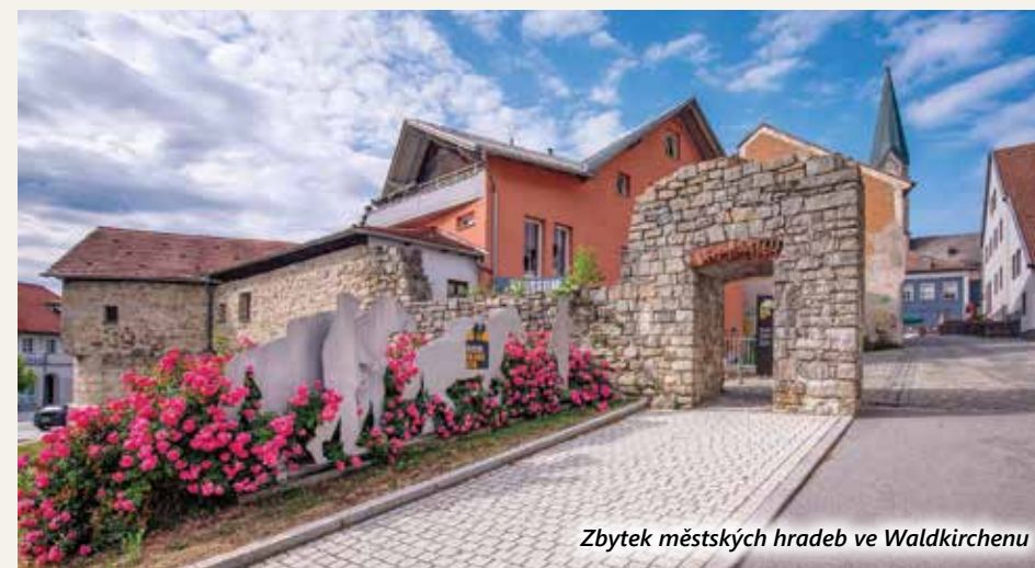
Zbytek městských hradeb ve Waldkirchenu

Města a městečka v bavorském příhraničí většinou nemají staré městské hradby s baštami. Waldkirchen je ale má. Důvodem byly nájezdy Mikuláše Kaplíře ze Sulevic, který se svými lidmi městečko několikrát napadl v roce 1458. Nato pasovský biskup vydal povolení ke stavbě městských hradeb.