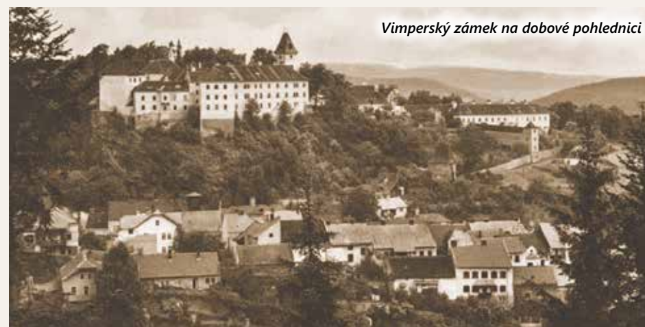
Vimperký zámek na dobové pohlednici

Textilní průmysl se tady začal rozvíjet na počátku 20. století, kdy vznikla textilka firmy Joss & Löwenstein, po roce 1945 n. p. Šumavan se závody ve Vimperku, Prachaticích, Klatovech. Po roce 1990 firma zanikla, podobně jako vimperské tiskárny. Vimperk byl také sídlem několika vojenských útvarů, pro které byl nad městem v místě zvaném U Sloupu postaven velký kasárenský areál, dnes obsazený různými firmami.