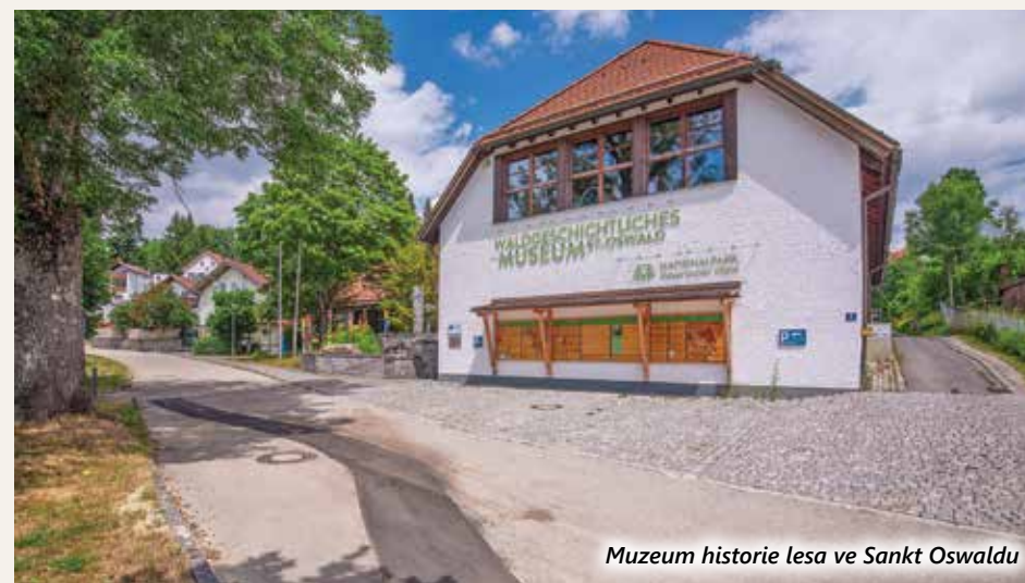
Muzeum historie lesa ve Sankt Oswaldu