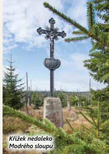
Křížek nedaleko Modrého sloupu

Do dalšího místa na Zlaté cestě se nedostanete ani pěšky, ani na kole, ani autem. Důvodem je zákaz cesty z Březníku na Luzný přes Modrý sloup. Nezbyvá než se do Waldhäuseru dostat po bavorských silnicích.