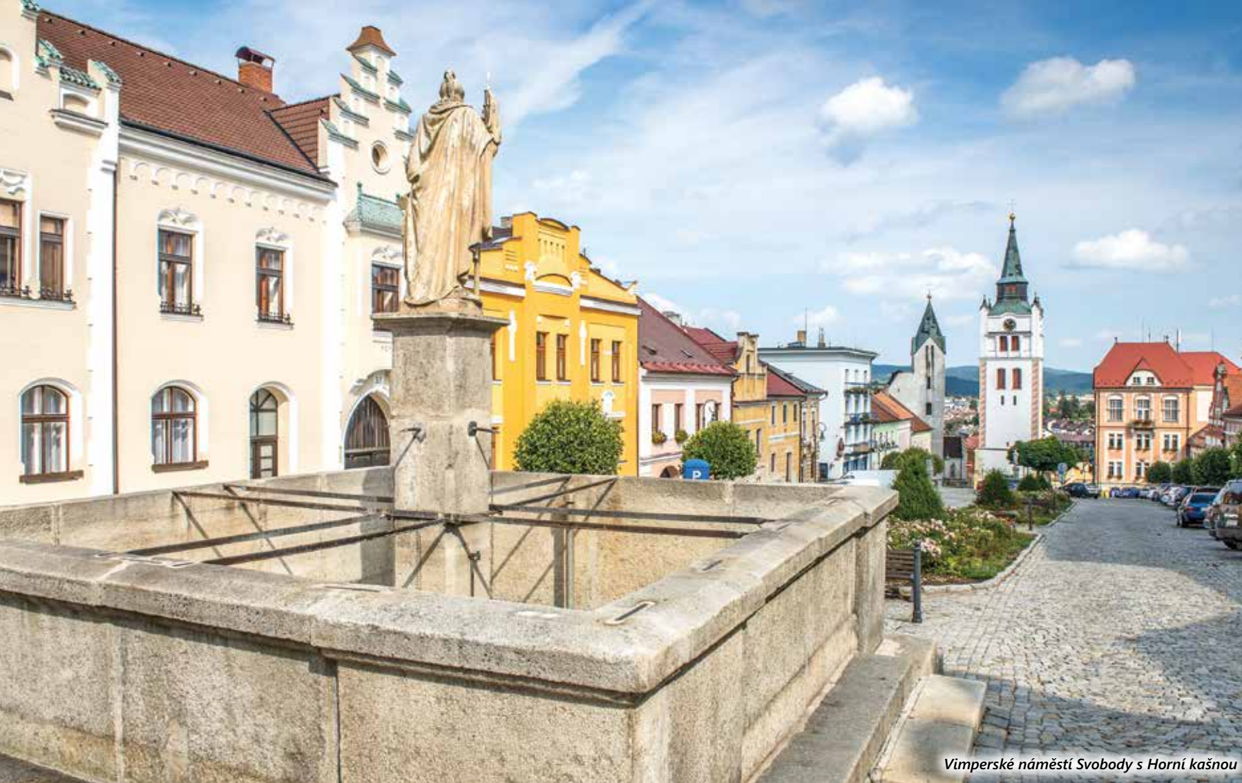
Vimperké náměstí Svobody s Horní kašnou