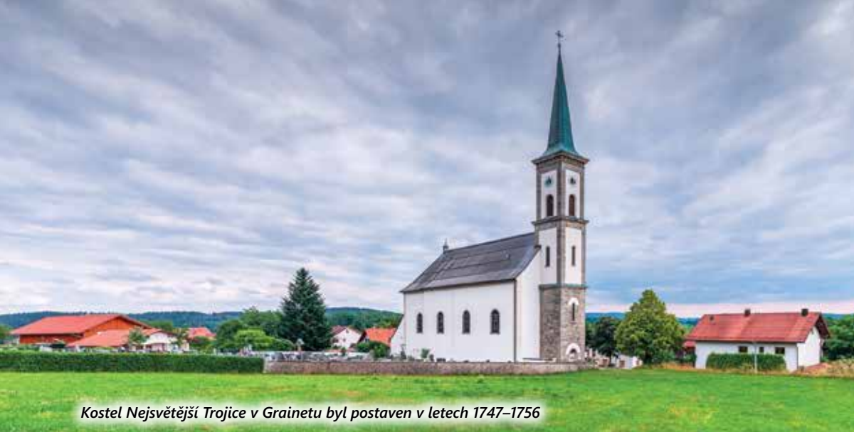
Kostel Nejsvětější Trojice v Grainetu byl postaven v letech 1747–1756