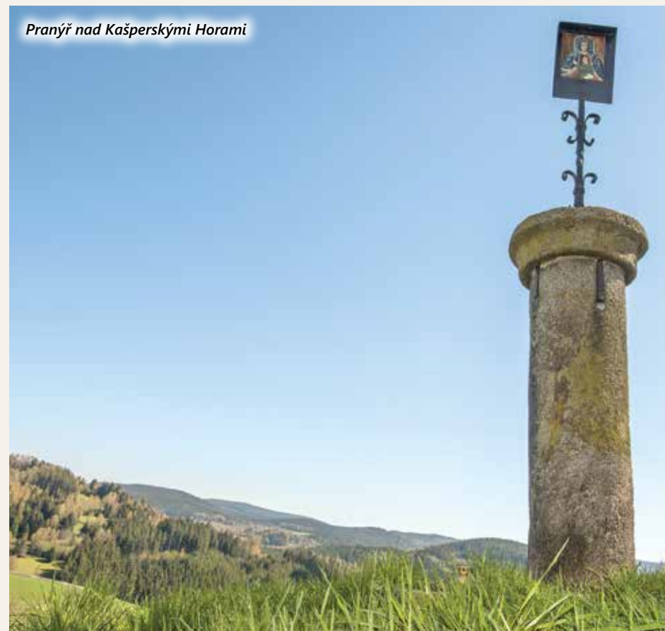
Pranýř nad Kašperskými Horami