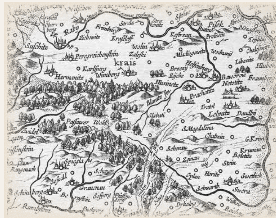
Poprvé se Zlatá stezka (Gulden Steig) objevila na mapě Čech z roku 1619 od Pavla Aretina z Ehrenfeldu. Tato mapa se zachovala v jediném exempláři.