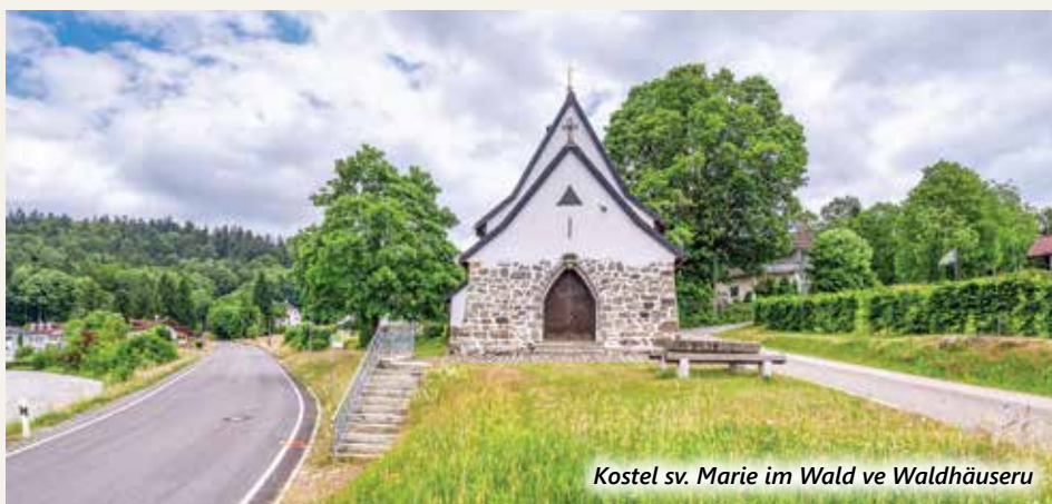
Kostel sv. Marie im Wald ve Waldhäuseru

V dobách provozu Zlaté stezky to bývalo důležité místo na pasovské straně, dnes je to poklidná osada s kostelíkem P. Marie v lese a dvěma lyžařskými vleky. Waldhäuser je také východiskem pro výstup na horu Luzný. Ta se svými 1 373 m n. m. patří mezi šumavské vrcholy vyšší než 1 300 m, kterých je celkem 28. K výstupu můžete využít buď cestu Letní (Sommerweg), nebo Zimní (Winterweg). Odměnou za výstup bude nádherný panoramatický výhled na českou i bavorskou stranu.