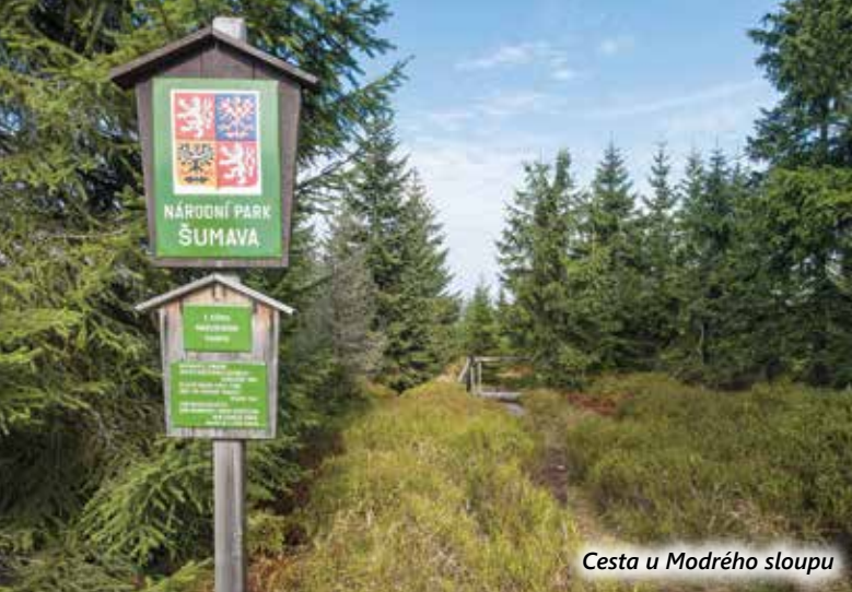
Cesta u Modrého sloupu