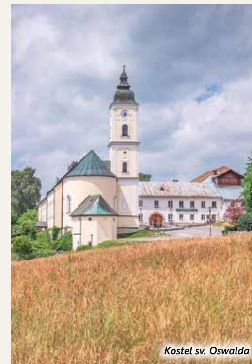
Kostel sv. Oswalda

Návštěvu tohoto moderního muzea bychom neměli vynechat. Jsou zde mluvící stromy, představí se nám obyvatelé horské vesnice, najdete zde vše, co souvisí s využíváním lesa v minulosti, uvidíte v činnosti moderní stroje určené k těžbě dřeva. Na modelech uvidíte proměny vlaků na lokální trati a mnoho dalších zajímavostí. Mezi památkami na železnou oponu je i malý kus z trupu československého MiGu, který havaroval v bezprostřední blízkosti hranice.