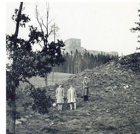
Lokalita pod Radyní na snímku

V jedné věci měli plzeňští novináři pravdu. Četnictvo začalo usilovně pátrat po dalších pytlácích, kteří byli vraždě hajného Matase přítomni. Bylo totiž zřejmé, že si osudného