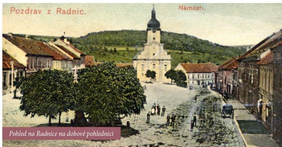
Pohled na Radnice na dobové pohlednici

Válečné boží mlýny melou také pomalu, ale jistě. A tak pražské místodržitelství 11. listopadu 1914 rozpustilo radnické obecní zastupitelstvo a důvodem byla „okázalá neúčast“ vedení města na slavnostních bohoslužbách. Podle mínění rokycanského okresního hejtmantství tím byla