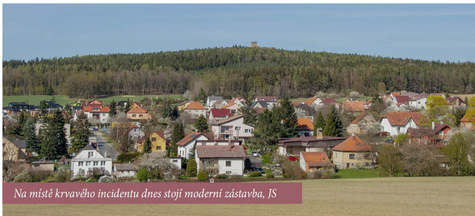
Na místě krvavého incidentu dnes stojí moderní zástavba