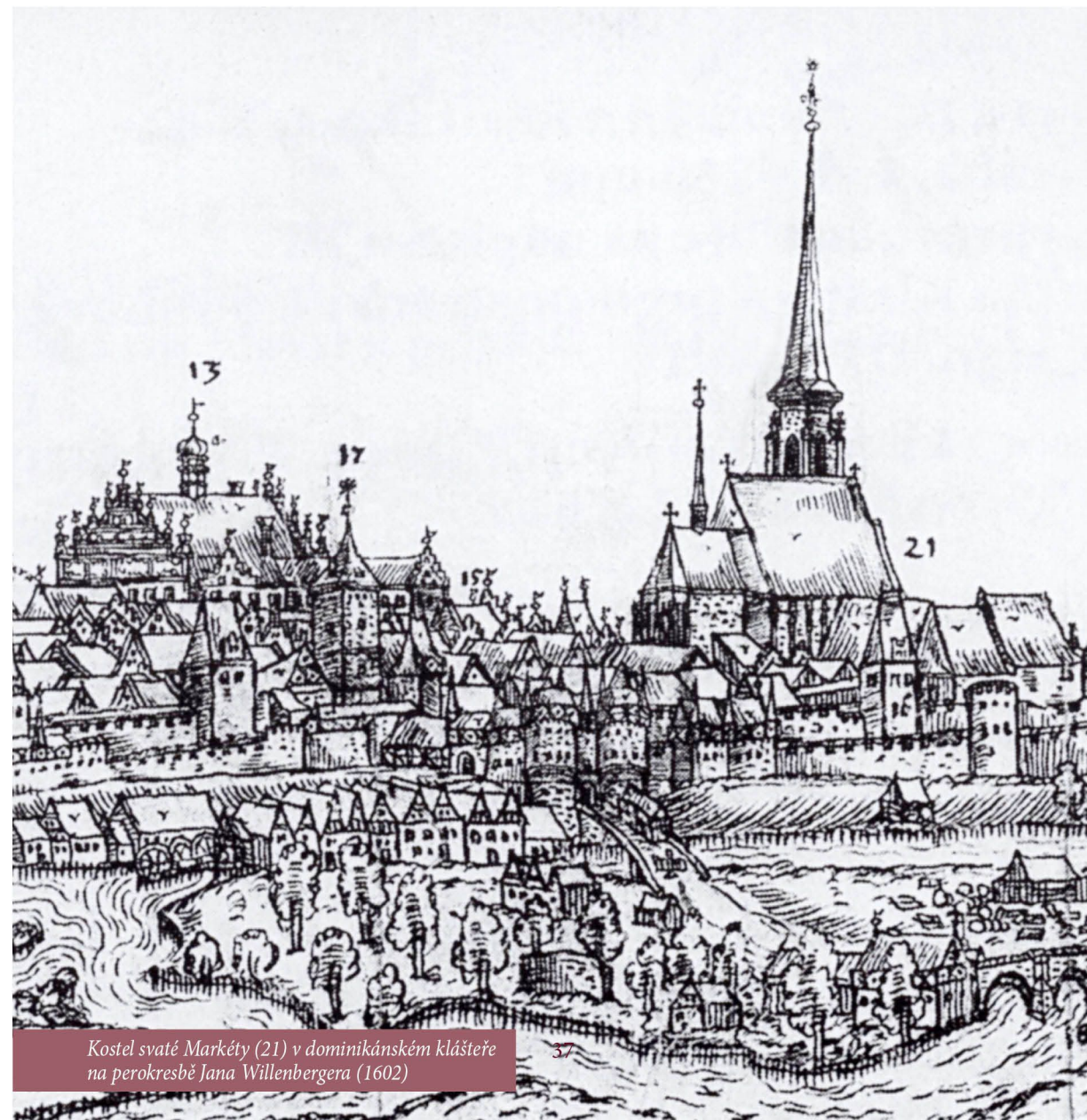
Kostel svaté Markéty (21) v dominikánském klášteře na perokresbě Jana Willenbergera (1602)

Teprve když pan převor zburcoval ve městě další lidi, podařilo se nepřítelny mnicha zajmout. Na příkaz otce představeného a v jeho doprovodu byl poté konečně odveden do šatlavy. Troufalý kněz v šatlavě do rána vystrízlivěl, ale ani poté se mu pokora nevrátila. Naopak začal rozesílat stížnosti na příkoří, které jej mělo o svatojánské noci potkat, a hledal zastání u nejvyšších katolických prelátů. Jeden z těchto dopisů, adresovaný papežskému legátu Horatiovi, byl vyslyšen. Všechny, kdo se měli provinít „křivdou“ spáchanou na vězněném mnichovi, potrestal